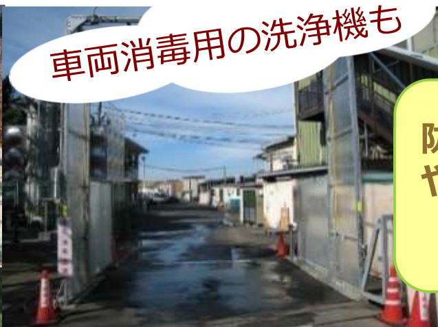
車両消毒用の洗浄機も