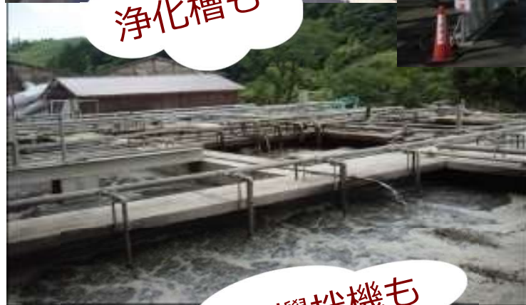
発酵舎・攪拌機も