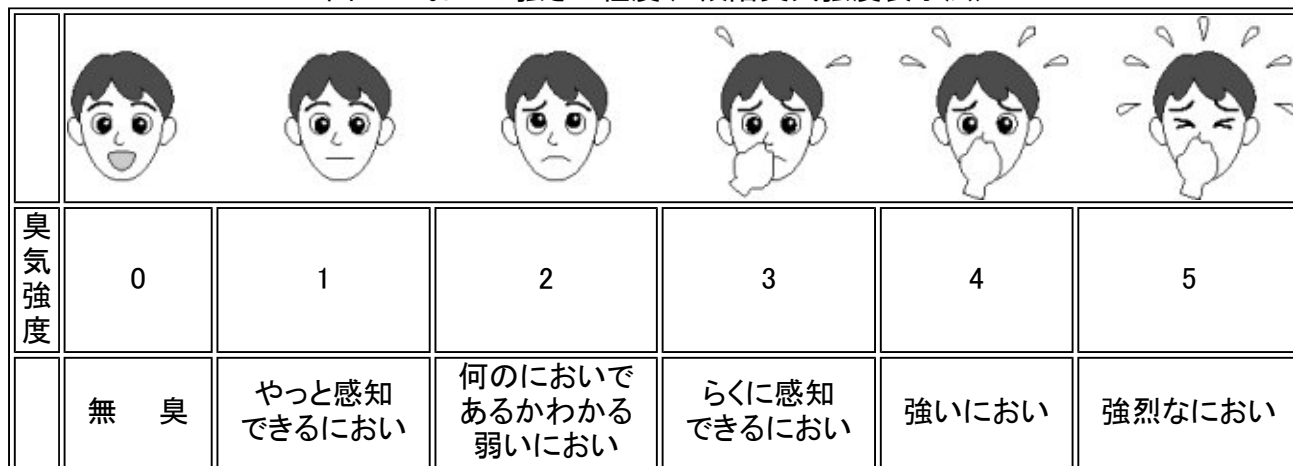
図1 においの強さの程度(6段階臭気強度表示法)

注) 悪臭防止法に定める悪臭物質の許容限度濃度および都道府県条例における臭気指数の基準(臭気指数10～21)については、臭気強度2.5～3.5相当の値で設定しています。