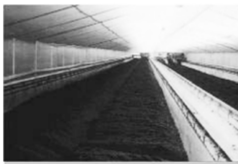
1次発酵施設 直線スクープ2基×4レーン