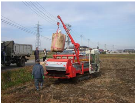
写真5 フレコンバッグを用いた堆肥施用