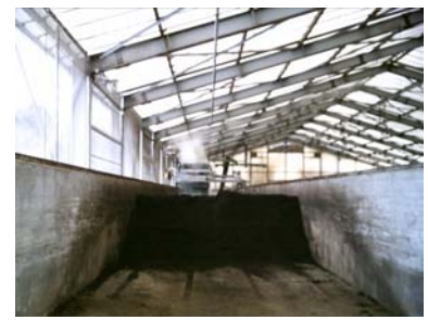
写真2 オープンロータリー 攪拌発酵槽（攪拌前） 写真3 オープンロータリー 攪拌発酵槽（攪拌後の湯気の発生） 写真4 スクープ攪拌発酵槽