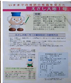
写真7 40リットル袋入り堆肥（裏面の解説）