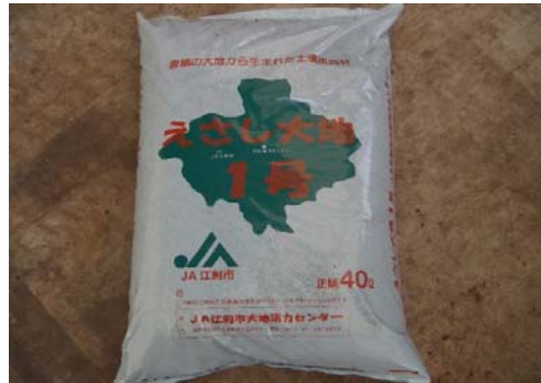
写真6 40リットル袋入り堆肥