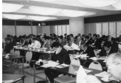
写真1 全国堆肥センター協議会設立総会 写真2 全国堆肥センター協議会設立総会出席者